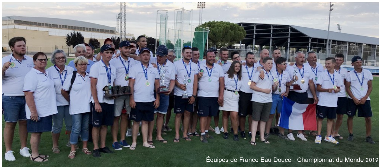
Équipes de France Eau Douce - Championnat du Monde 2019